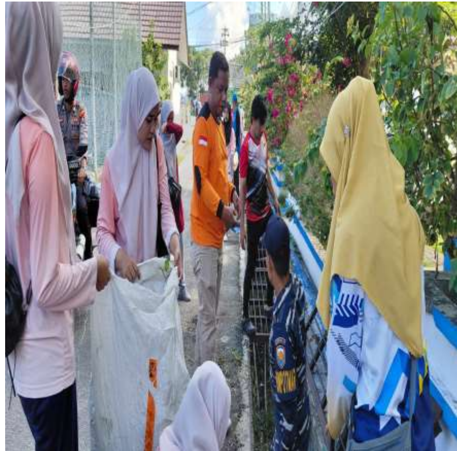
Kecamatan Siantan Mengadakan Goro Gabungan Bersama Kelurahan Dan Angkatan Laut. Kegiatan Goro Di Laksanakan Mulai Dari Gedung BPMS Sampai Ke Jalan Kantor Sekwan . Kegiatan Di Laksanakan Pada Hari Selasa Tanggal 12 Mei 2026