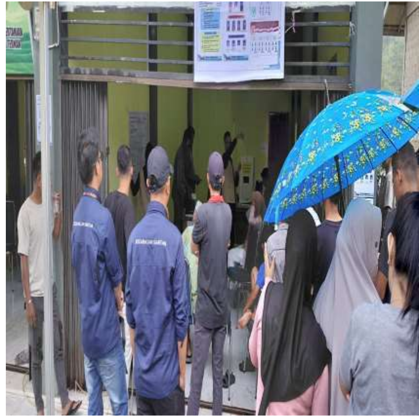
Sekretaris Kecamatan Siantan Beserta Kasi Trantib Dan Staf Mengadiri Undangan Pemiluhan Anggota DPD Desa Tarempa Selatan ,Kegiatan Di Lasanakan Pada Hari Minggu Ntanaggaal 23 Mei 20206 Di Bumdes Desa Tarempa Selatan