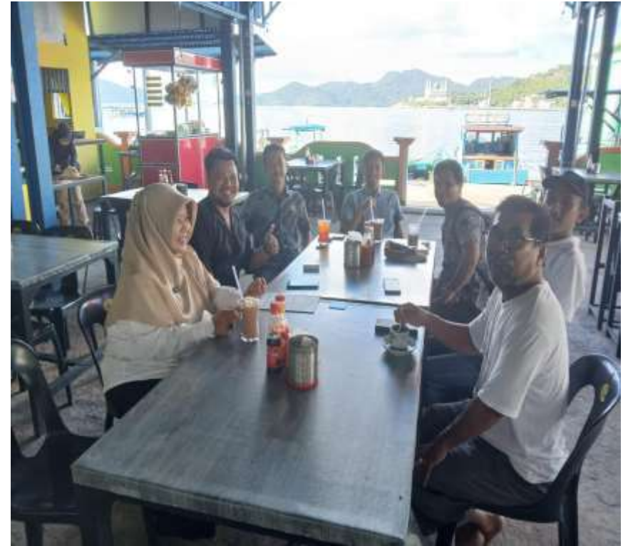
Sekretaris Kecamatan Badariyah Menghadiri Acara Ramah Tamah Setelah Setelah Musyawarah Desa Di Bumdes Desa Tarempa Barat. Kegiatan Di Laksanakan Pada Hari Rabu 13 Mei 2026