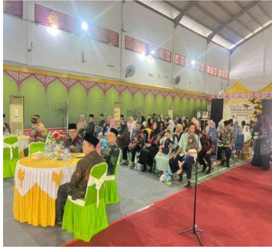
Sekretaris kecamatan menghadiri undangan perpisahan anak anak MIN tarempa ,kegiatan juga di hadiri oleh kemenag kabupaten kepulauan anambas dan seluru tendik dan orang tua wali murud kelas IV kegiatan di lasanakan pada hari kamis 21 mei 2026 di gedung BPMS