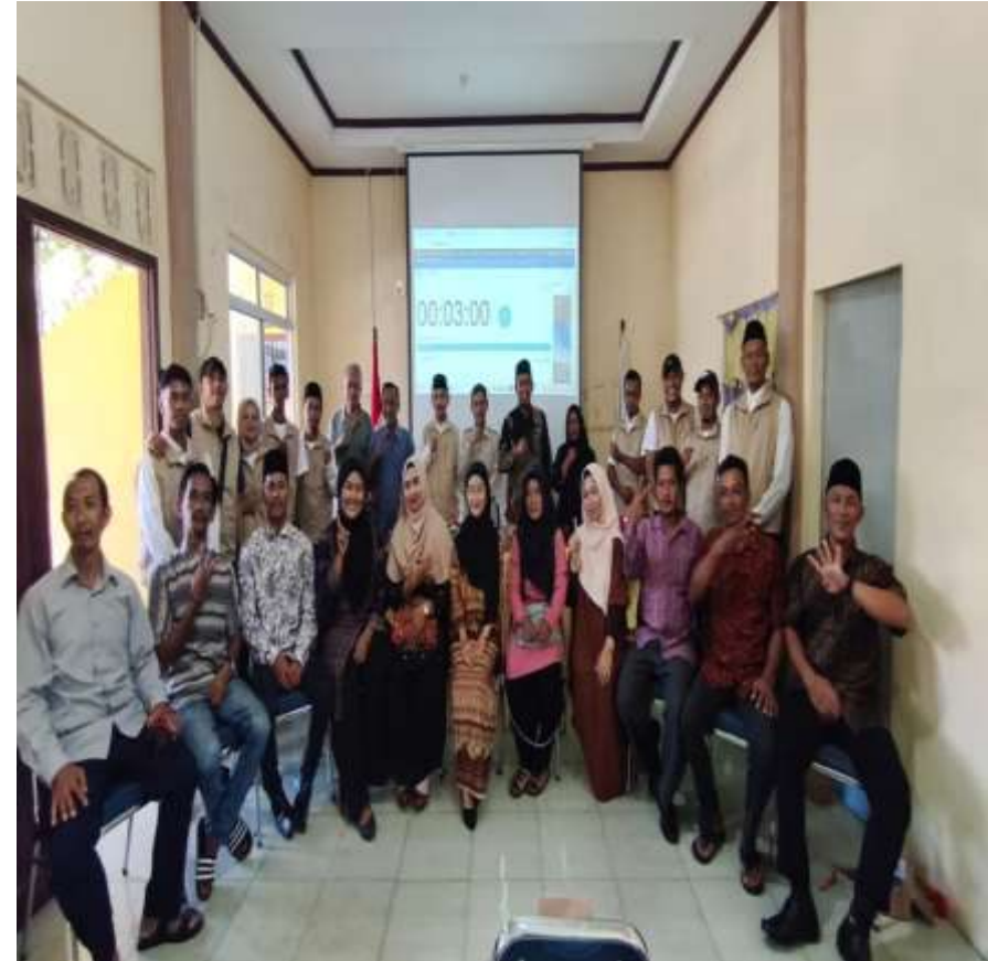
Staf PMD Mewakili Camat Siantan Dalam Menghadiri Undangan Undangan Penetapan Dan Pencabutan No Urut Calon BPD Desa Tarempa Selatan Dan Di Hadiri Oleh Seluruh Perangkat Desa Dan Tokoh Masyarakat Desa Tarempa Selatan. Kegiatan Di Lasanakan Pada Hari Minggu Tanggal 3 Mei 20206 Di Kantor Desa Tarempa Selatan