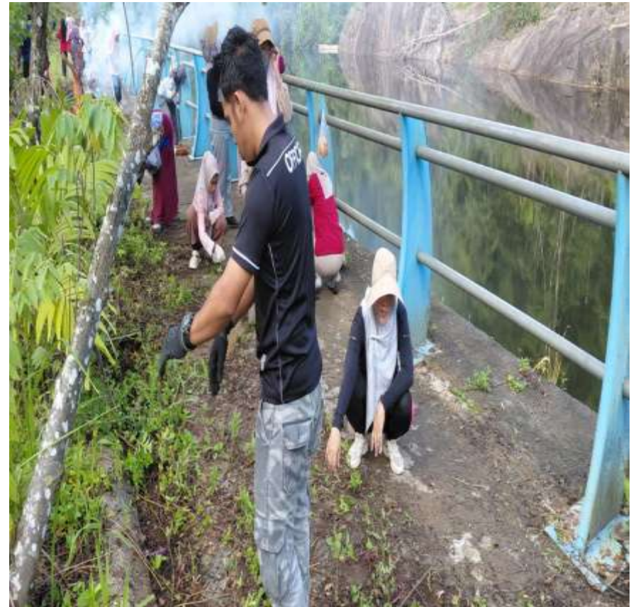
Camat Siantan Beserta Kasi Dan Kasubag Dan Staf Melakukan Kegiatan Gotong Royong Bersama Di Tempat Penampungan Air Di Daerah Gunung Embun Lintang Yang Terletak Di Desa Tarempa Selatan. Kegiatan Di Laksanakan Pada Hari Jumat Tgl 8 Mei 2026