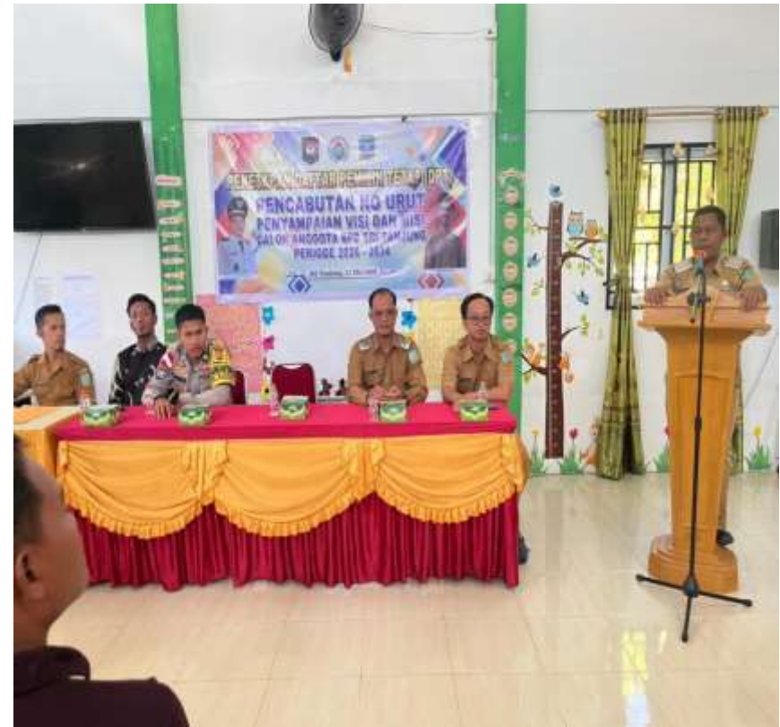
Camat Siantan Menghadiri Undangan Dalam Pencabutan Nomor Urut Calon DPD Desa Sri Tanjung , Kegiata Juga Di Hadiri Oleh Kepala Desa Sri Tanjung Babinsa, Babinkantibnas TA Dan Calon Peserta . Kegiatan Di Lasnaka Poada Tanggal 11 Mei 2026